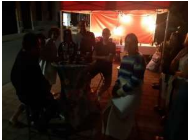
De plakkers / organiserend team